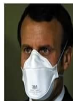
Emmanuel Macron Champion des plus riches Intime de Bernard Arnault