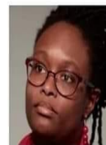
Sibeth Ndiaye Ministre du Mensonge Concurrente des Fake-news