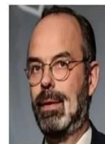
Edouard Philippe Premier collaborateur Candidat à la mairie du Havre