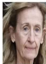
Nicole Belloubet Ministre des Passe-Droits et des Prisons