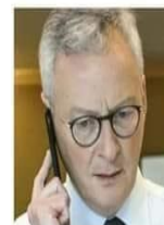
Bruno Le Maire Ministre du Capitalisme Protecteur des Dividendes