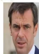
Olivier Véran Ministre du Lobby pharmaceutique et lucratif