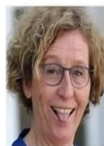
Muriel Pénicaud Ministre de l'Exploitation et des 60h par semaine