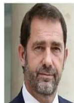
Christophe Castaner Ministre de la Répression Gardien du stock de LBD